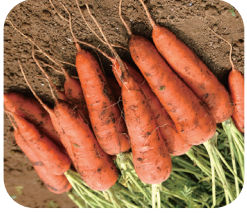
【特産】 茨城県 銘産地 指定 人参