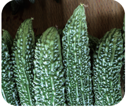
【特産】 茨城県 銘産地 指定 たけのこ

「えらび」という品種に統一し、肉付きが良くて苦みが少なく、色鮮やかなたけのこが特徴です。そのままだけのこも利用し、そのままだけのこをそのまま食べてもおいしい味わいを楽しめます。夏、冬、夏野菜で、夏、冬防止にも役立ちます。