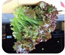
【特産】 茨城県 銘産地 指定 ササニシキ米

パリッとした食感で、柔らかく、ほのかに苦みがあつた古河の「彩葉」があるのが特徴です。他の生産地と比べてボリュームが豊富で甘み強いのが特徴です。△感があり、品質が良いと市場でも高評価を得ています。βカロチンなどの栄養も豊富なため、サラダなど色々なしで楽しむことができます。